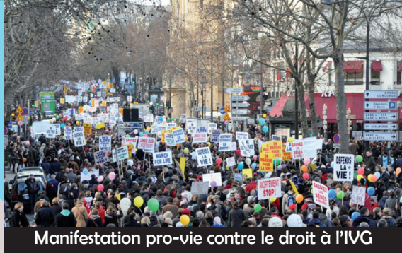
Manifestation pro-vie contre le droit à l'IVG